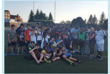
Les participants au Mondial de soccer du SPVM édition 2016