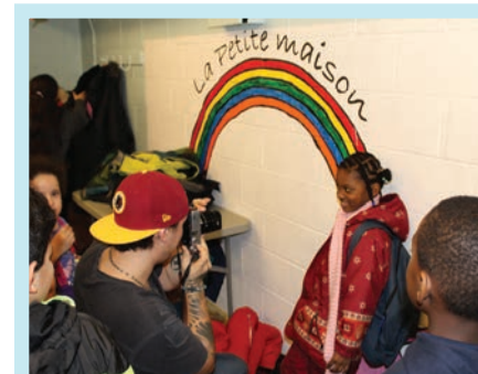
Samian en séance photo avec les enfants de La Petite Maison

Originaire de Pikogan, une petite communauté autochtone enclavée dans la ville d'Amos en Abitibi-Témiscamingue, Samian est un artiste engagé qui dénonce les inégalités sociales et prend position en faveur de communautés minoritaires. Depuis quelques années, ce récipiendaire de l'édition 2017 du prix Artiste pour la paix décerné par le groupe du même nom, photographie des gens de différentes origines qu'il rencontre à travers ses voyages. L'être humain est le fil conducteur de son œuvre.