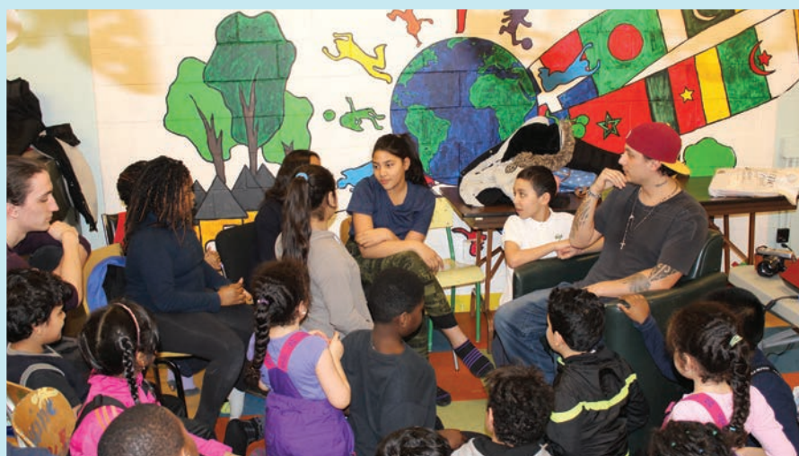
L'artiste Samian en discussion avec les enfants de La Petite Maison lors de sa visite

C'est dans le cadre du projet VisArts que l'artiste métis Samian (de son vrai nom Samuel Tremblay), rappeur et photographe algonquin, est venu parler photographie avec les enfants de La Petite Maison. Cinquante jeunes âgés entre 6 et 12 ans ont participé à l'activité qui s'est tenue le 20 février dernier.