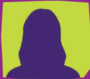
Fédia Maayouf Technicienne comptable