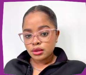
Maïna Monopol Travailleuse de Milieu 12-25 ans